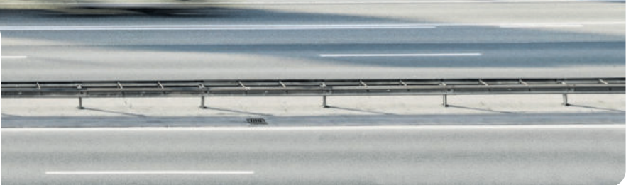
Fassadenansicht des flexA2 von der Autobahn A2.