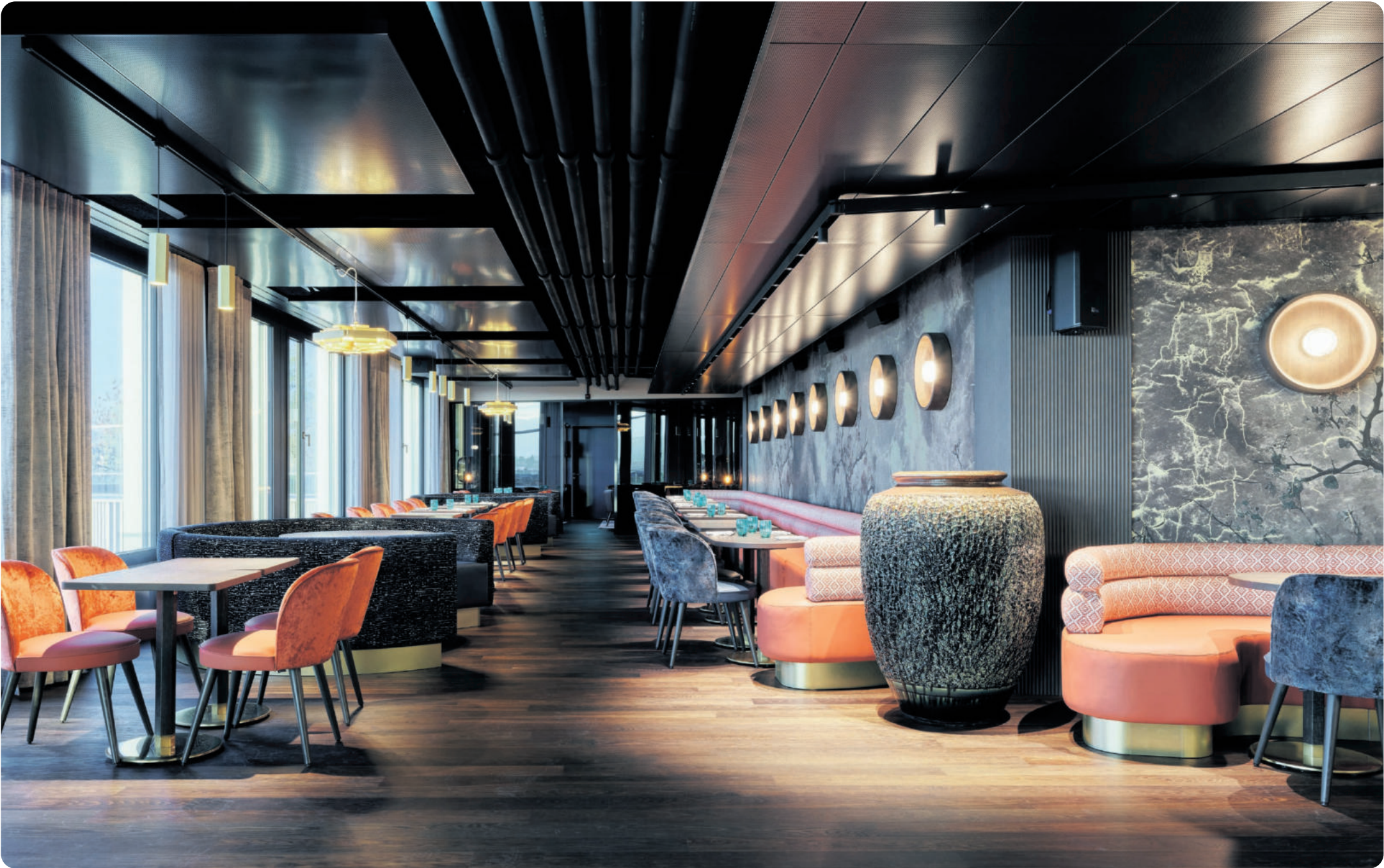
Das Varathans25 ist im fünften Stockwerk untergebracht.