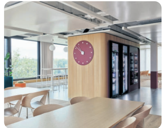
Blick in den Aufenthaltsraum des flexA2.

Mit dieser Konzepttreue überzeugt das Gebäude. Die konsequente Trennung von Struktur, Technik und Ausbau sowie technisch gefügte und materialeffiziente Konstruktionen erlauben Anpassung, Servicefreundlichkeit und Wiederverwendung. Echte und unterhaltsarme Materialien werden die Langlebigkeit mühelos gestalten.