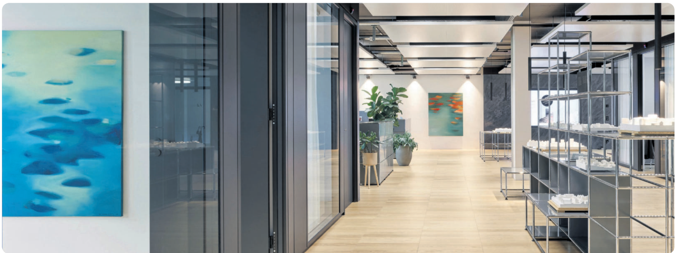
Die konzeptstarken Büroräumlichkeiten der Leuenberger Architekten.