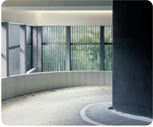
Auffahrt zur Lagerfläche der LUEG AG.