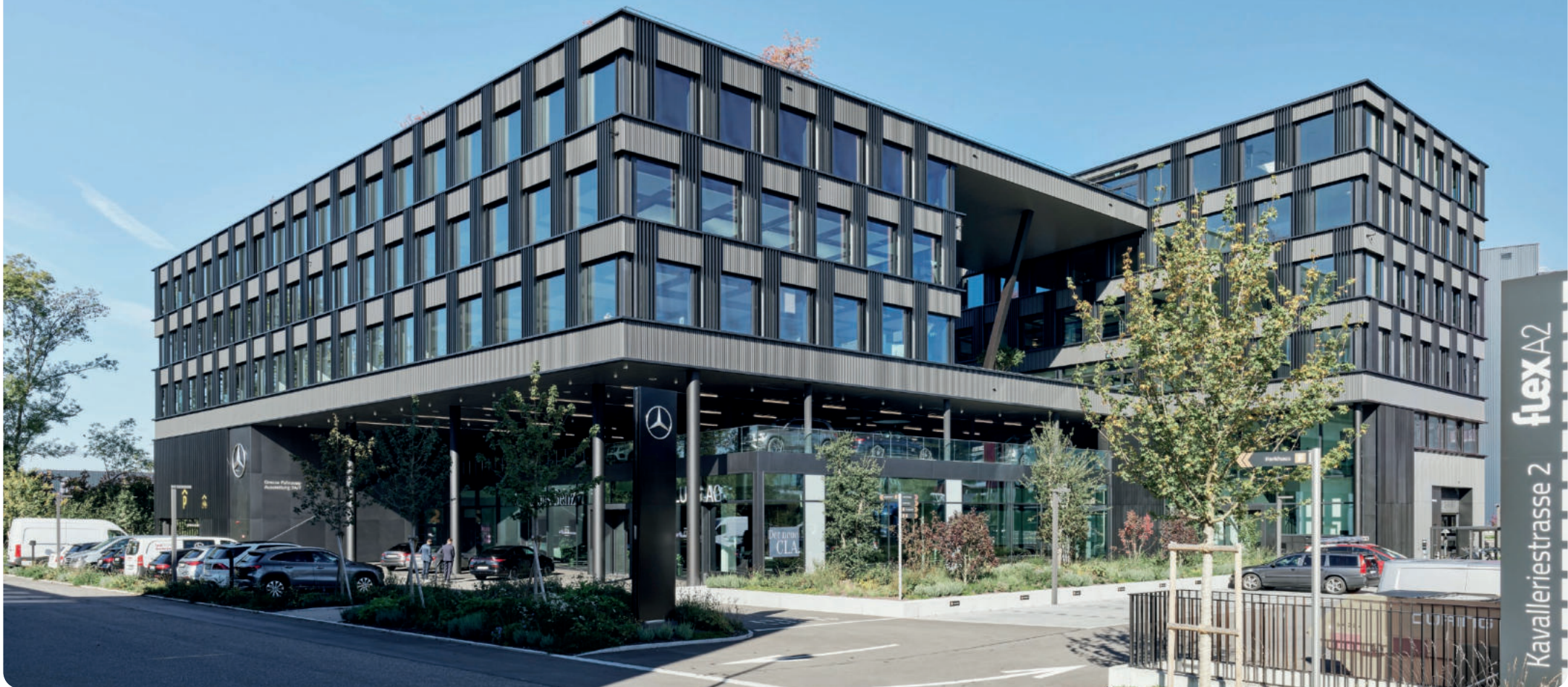
Zufahrt zum flexA2 von der Kavalleriestrasse.

An der Kavalleriestrasse in Sursee ist mit dem flexA2 ein beeindruckender Gewerbebau entstanden, ein sichtbares Zeichen für Unternehmmergeist, Architekturqualität und regionale Verbundenheit – ein Bau, der Sursee wirtschaftlich stärkt und das Stadtbild bereichert.