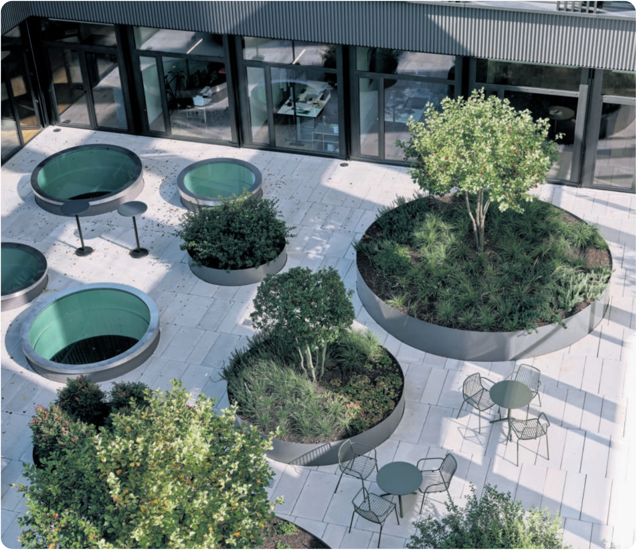
Der Innenhof auf Höhe der Leuenberger Architekten von oben.