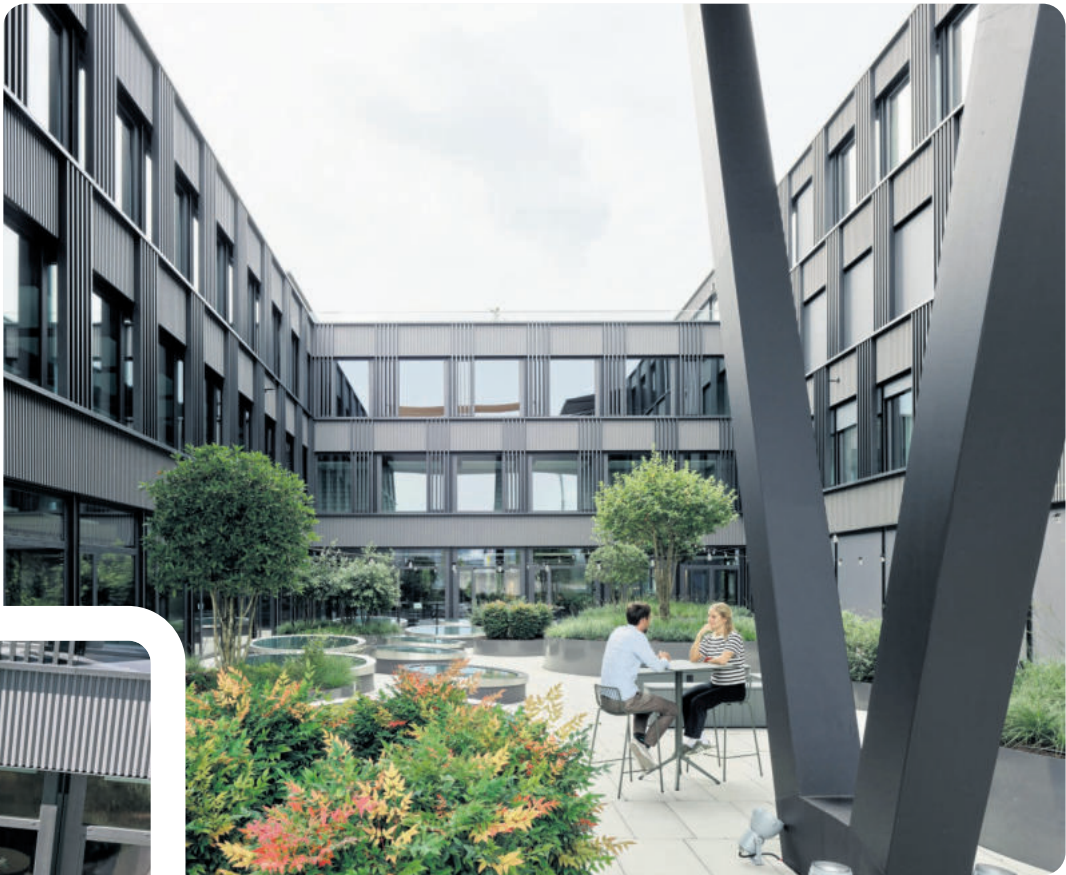
Die grüne Oase im Innenhof lädt zum Verweilen ein.