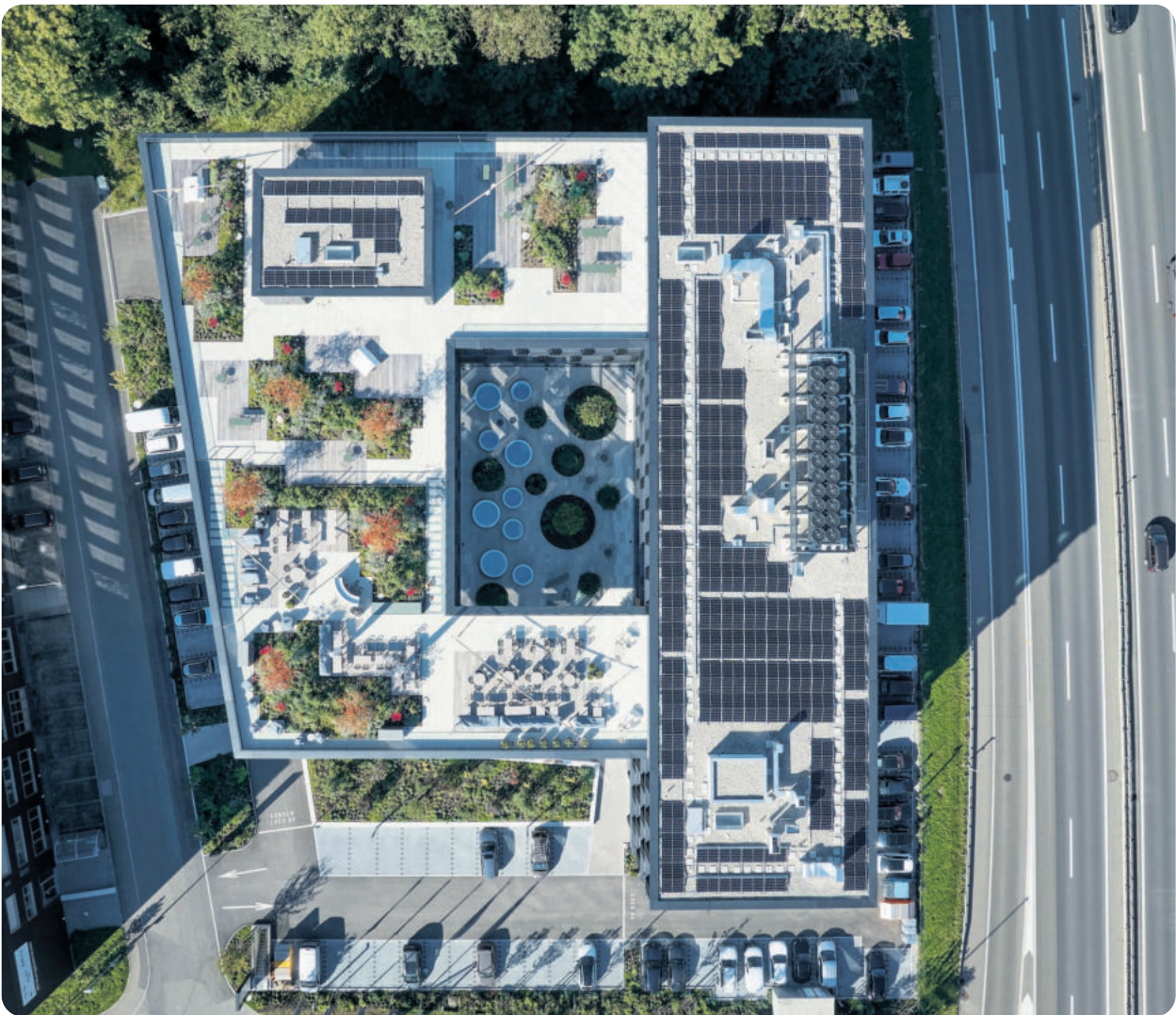
Und noch einmal das Ganze von oben mit Begrünung und PV-Anlage, rechts die Autobahn.